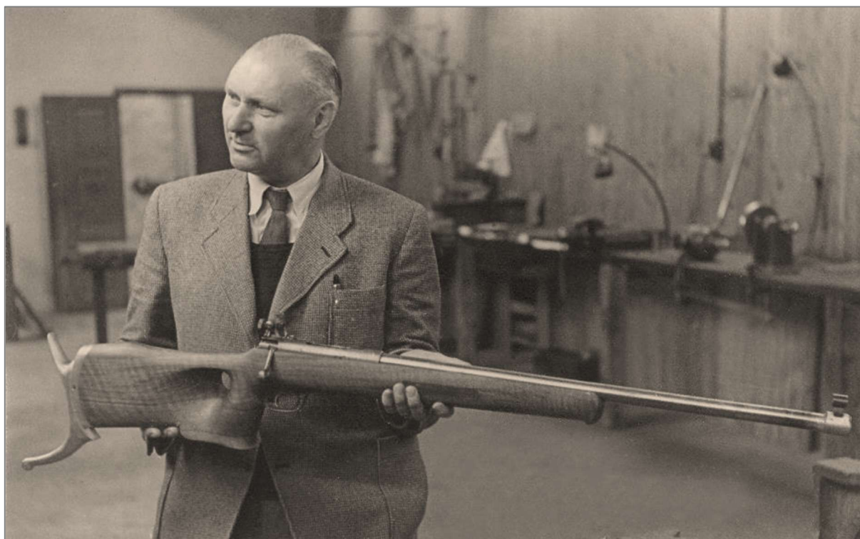
En Otterup-riffel, specielt bygget til internationale skyde-matcher.